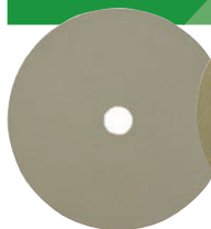
K58 GR. 120 DESBASTE