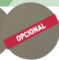
K58 GR. 1500 PULIDO BRILLO