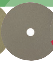
K58 GR. 800 PULIDO BRILLO