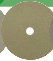
K58 GR. 200 PREPARACIÓN PULIDO